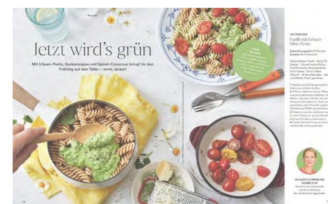
Unverbindliche redaktionelle Umsetzungsbeispiele. Die Unabhängigkeit der Redaktion bleibt in jedem Fall unberührt. Ein Abdruck redaktioneller Beiträge ist dem Kunden nicht geschuldet.