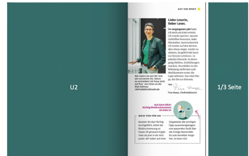
U2 + 1/3 Seite im Editorial