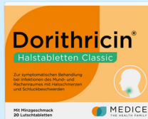
Dorithricin® Halstabletten Classic PZN: 07727923