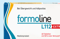
formoline L112 EXTRA PZN: 13352309