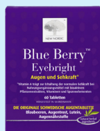
New Nordic Blue Berry™ Eyebright PZN: 6328894