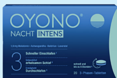
OYONO® NACHT INTENS PZN: 18675046

Bei den beispielhaft aufgeführten Produkten handelt es sich um verkaufstarke Präparate, wie sie im typischen Sortiment der Apotheke vorkommen. Die Übersicht ist ein Service des Vertriebs des Wort & Bild Verlags. Sie hat keinen Empfehlungscharakter.