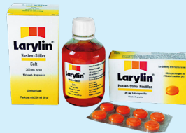
Larylin® Husten-Stiller Saft/Pastillen PZN: 04759897/04960257